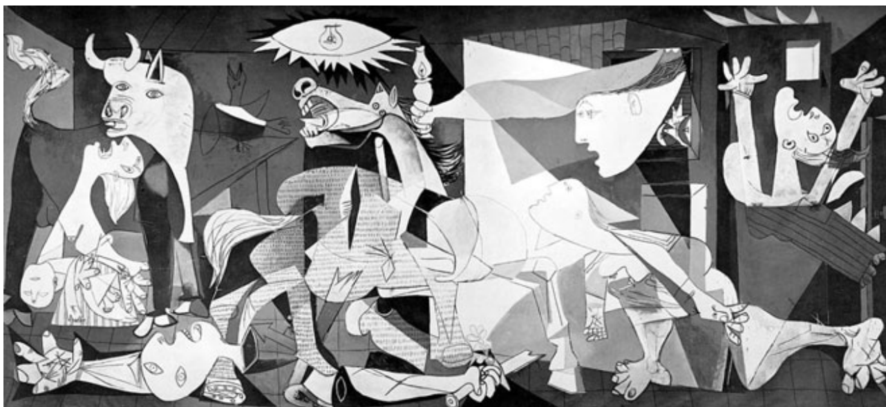
Pablo Picasso, Guernica, 1937, Museo Nacional Centro de Arte Reina Sofía, Madrid Óleo sobre lienzo (3,5m x 7,8m)