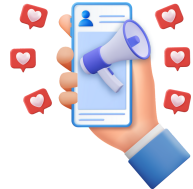
un seguidor = un follower