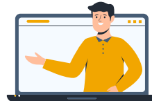
ver vídeos ver tutoriales