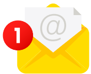
el correo electrónico