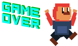
los videojuegos (jugar a los videojuegos)