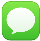
un mensaje (mandar/enviar...)