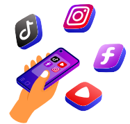
la red social las redes sociales (conectarse a ..)