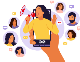
el / la influencer