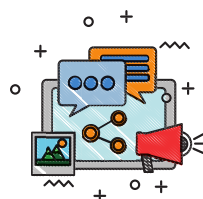
hacer un comentario