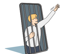
ser adicto estar enganchado