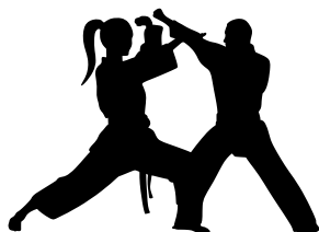
las artes marciales