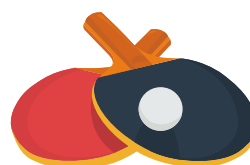
el tenis de mesa