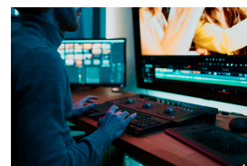
desarrollador/a de video juegos