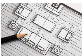
decorador/a de interior