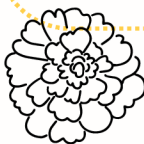
la flor de cempasúchil

Los mexicanos van al cementerio a limpiar y decorar las tumbas de sus seres queridos ( êtres chers ) con flores y velas. También llevan comida ( de la nourriture ) y comen allí sentados en las tumbas. Se celebra la fiesta con música.