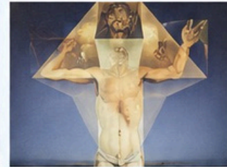
Cristo de San Juan de la Cruz (1951)