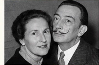
Dalí y Gala