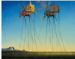
Los elefantes (1948)