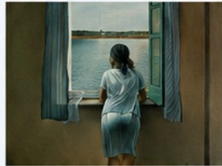
Muchacha en la ventana (1925)