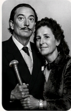
Dalí y Gala

Dalí tenía una personalidad exagerada y original. Le gustaba la provocación, la imaginación y los sueños.