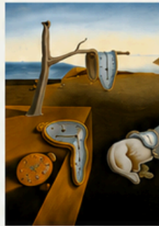
La persistencia de la memoria (1931)

Los relojes blandos simbolizan el tiempo y los sueños.