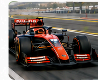
piloto de Fórmula Uno