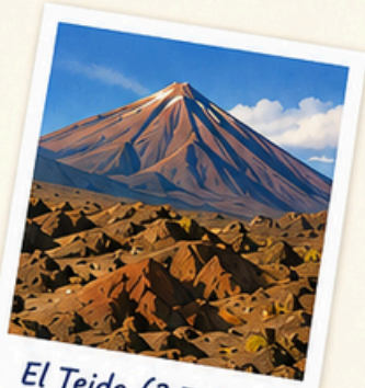
El Teide (3.718 m)